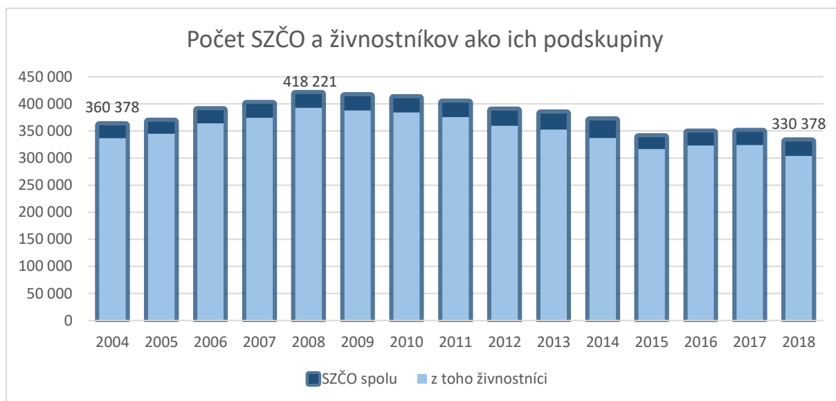
Graf č. 1: Počet SZČO a ich najpočetnejšej skupiny – živnostníkov

2013 a 2015, keď počet SZČO klesol o viac než 43 700. S najväčšou pravdepodobnosťou môžeme tento pokles pripísať, okrem mnohých iných legislatívnych zmien podrobnejšie popísaných pod tabuľkou č. 1, najmä zmene spôsobu uplatňovania paušálnych výdavkov účinného od 01.01.2013, keď bol zavedený strop pre uplatnenie maximálnych paušálnych výdavkov vo výške 5 040 eur ročne.