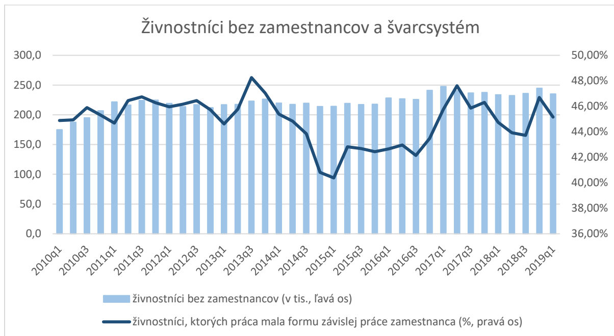
Graf č. 3: Živnostníci bez zamestnancov a miera využívania tzv. švarcsystému

Pri rozhodnutí začať podnikáť fyzická osoba väčšinou zvažuje jednu z dvoch foriem podnikania – podnikanie na základe živnostenského oprávnenia (najčastejšia forma SZČO) alebo prostredníctvom s. r. o. Každá z týchto foriem podnikania prináša svoje výhody aj nevýhody. Nakoľko sa tento test MSP ex-post prioritne zaoberá podnikaním na živnosť, v nižšie uvedenej tabuľke č. 1 sú uvedené hlavné výhody a nevýhody podnikania formou živnosti, v porovnaní s inými obdobnými formami podnikania, najmä podnikania formou s. r. o.